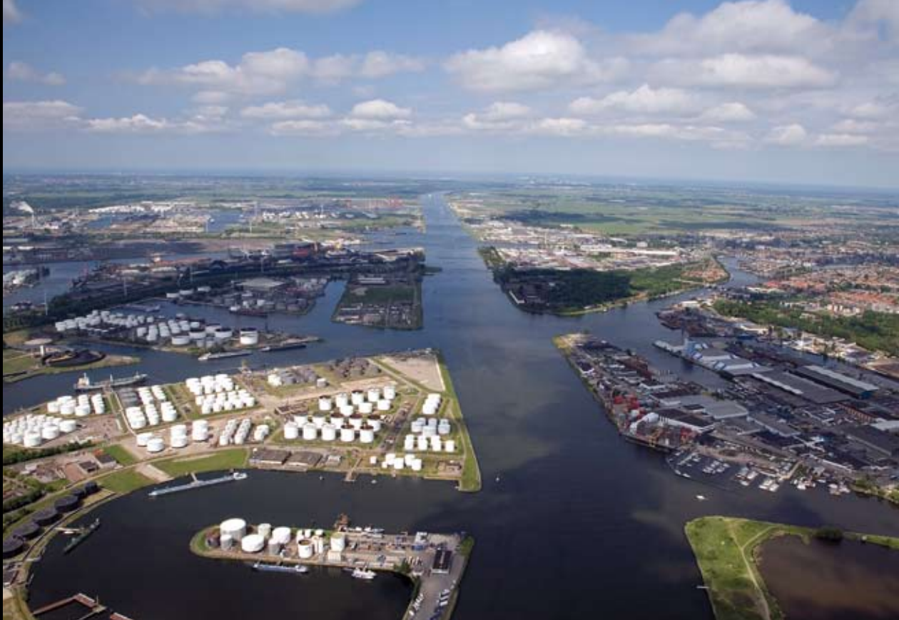
Factsheet van Haven Amsterdam, nummer 1, juli 2009

De ruimte in de haven is schaars, terwijl de vraag naar grond en gronduitgiften toeneemt. Door slim ruimtegebruik kan de overslag tot 2020 verdubbelen, terwijl de fysieke grenzen van de haven gelijk blijven.